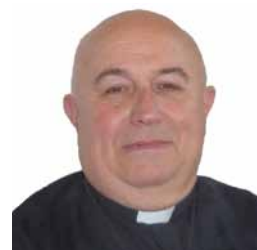
par l'abbé Gilbert Perritaz

Abonnement: Abo annuel: Fr. 35.— / soutien: Fr. 50.— Saint-Augustin SA, Service de l'adressage adressage@staugustin.ch Tél. 024 486 05 39